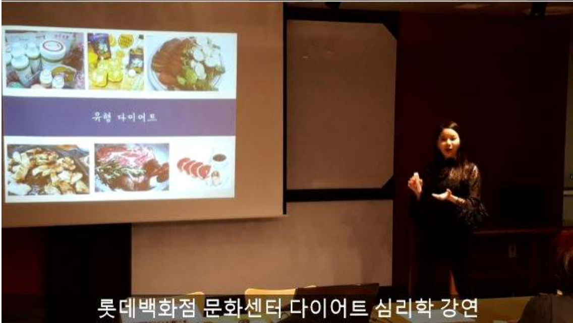
롯데백화점 문화센터 다이어트 심리학 강연