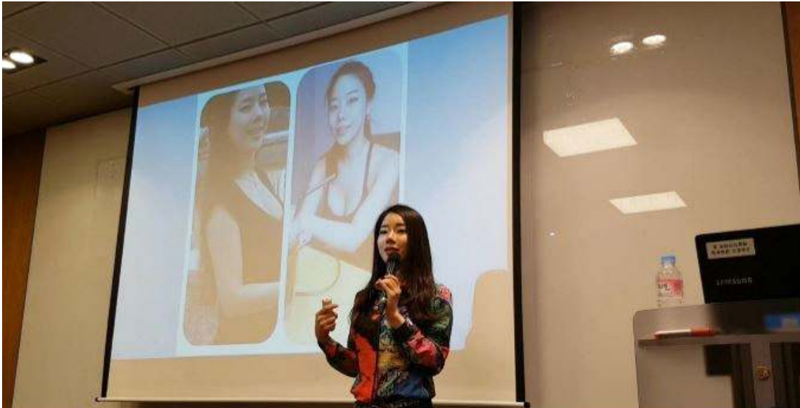
광화문 교보문고 식욕의 배신 다이어트심리학 저자 강연