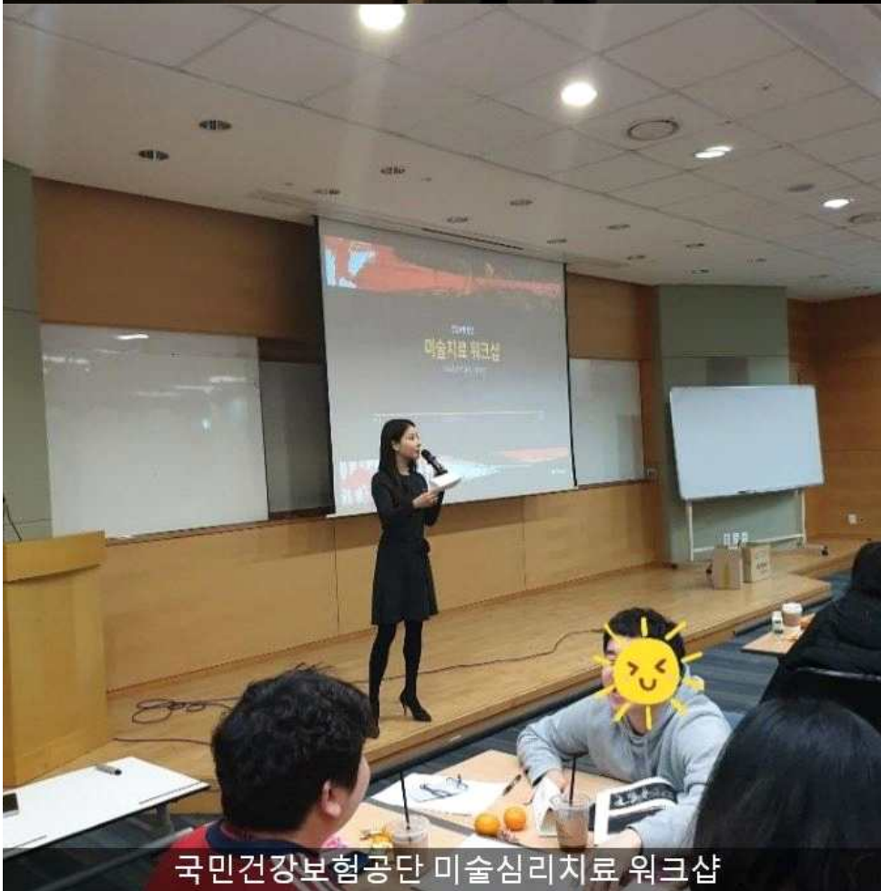
국민건강보험공단 미술심리치료 워크숍