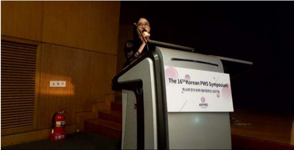
LG화학 프레더윌리증후군 환우회 예술과 식욕의 심리학