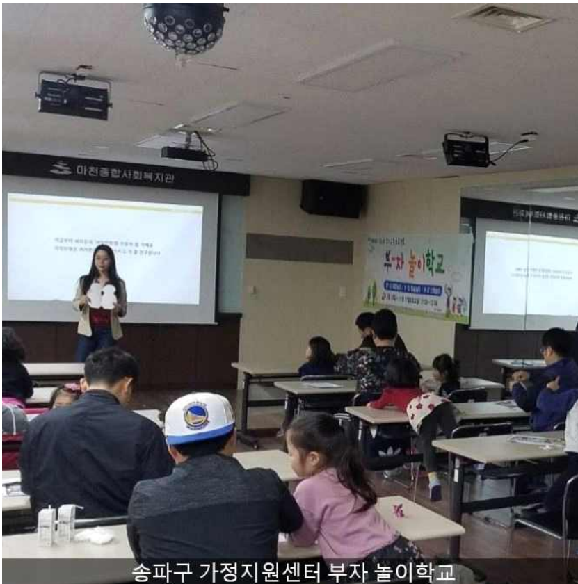
송파구 가정지원센터 부자 놀이학교