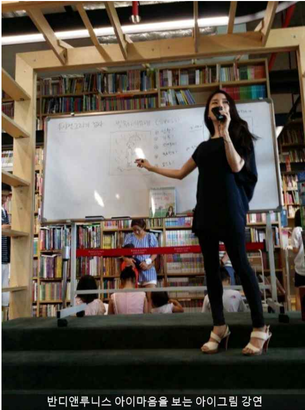
반디앤루니스 아이마음을 보는 아이그림 강연